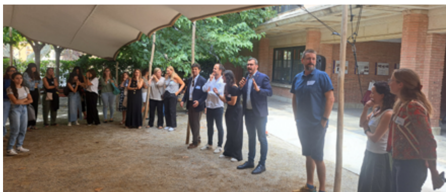
L'alcalde i la regidora d'Educació van donar la benvinguda als equips docents en un acte celebrat el 6 de setembre.

L'Ajuntament consolida un model educatiu inclusiu, dinàmic i en permanent diàleg amb la ciutadania, iniciat fa 20 anys amb l'adhesió a la xarxa de municipis educadors.