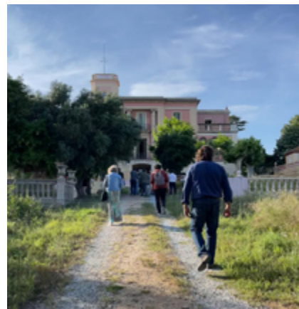
El 28 de maig es va fer la visita a La Miralda.

Pel que fa a la pregunta sobre quin és l'opció que estan més d'acord donada l'obligació de mantenir l'equilibri econòmic, més de la meitat dels enquestats han optat per l'opció de trobar un punt mig amb menys sostre comercial i nous habitatges. En referència als nous habitatges, l'opció més assenyalada (13) és que es potenciï l'aparició de més habitatge social; 10 preferei-