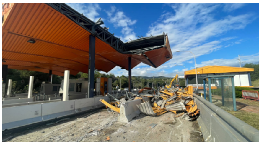
El desmantellament de les cabines permetrà endreçar l'accés d'entrada i sortida a l'autopista.

El desmuntatge de les cabines d'Alella forma part d'un paquet d'actuacions iniciat a finals d'abril per eliminar les instal·lacions que encara perduren