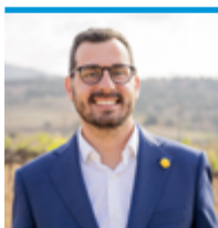
L'alcalde, Marc Almendro Campillo

Fa uns dies vam estrenar la remodelació de la nova plaça del carrer Àfrica i del parc de la Gegantona Facunda, una transformació justa i necessària, que dignifica el barri de Montals, una de les zones més denses del poble, pel que fa a població, comerç i alçada d'edificis, i amb poc espai públic. Sempre diem que la nostra màxima és fer d'Alella un poble millor, que treballem per millorar la qualitat de vida dels alellencs i les alellenques i que les persones sempre estan al centre de totes les nostres decisions.