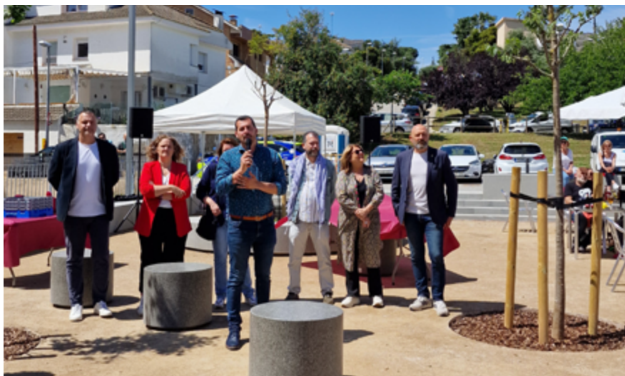
L'alcalde i altres membres del Consistori van participar en l'acte de benvinguda a la remodelació.

La pista asfaltada s'ha reconvertit en un espai d'estada, de sauló sòlid, enjardinat i accessible, amb connexió amb la zona de jocs existent mitjançant una rampa de fusta de comunica els dos espais. S'han instal·lat unes grans jardineres amb arbrat i espècies arbustives i mobiliari urbà. També s'ha incrementat l'espai per a vianants del carrer Àfrica, suprimint alguns aparcaments.