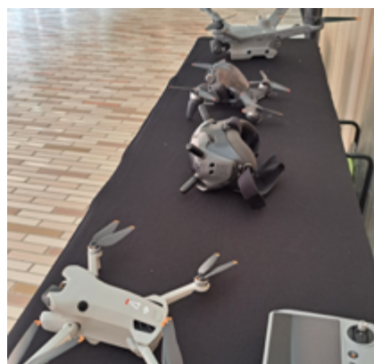
La jornada es va desenvolupar a l'Espai Arts Escèniques.

robatoris a domicilis. El sotsinspector va explicar que en els dos anys de funcionament s'han realitzat més de 250 serveis utilitzant com a eina operativa el dron i va anunciar que l'Ajuntament aspira a convertir Alella en plataforma de desenvolupament formatiu en tecnologia de drons, en seguretat i emergències.