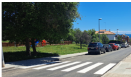
S'han adequat 16 passos de vianants a l'Eixample.

L'Ajuntament va enllestir a inicis de maig les obres de millora de l'accessibilitat al barri de l'Eixample, amb l'adequació i senyalització de passos adaptats per a vianants en diferents carrers. En concret s'han adequat 16 passos de vianants situats als encreuaments dels carrers Pau Vila, Creu de Pedra, Santa Gemma, Cervantes, Espígol i Londres i a la rambla de la Fontcalda. Les obres han suposat una inversió de 36.784€.