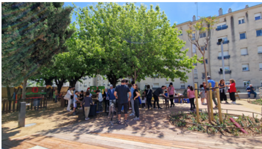
Amb la remodelació han quedat integrats el parc de la Gegantona Facunda i l'espai que ocupava l'antiga pista.