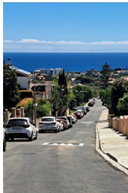
Nova pavimentació i reductors de velocitat a Fontcalda.