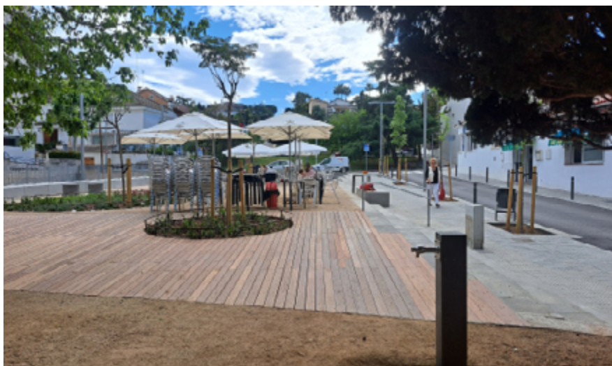
Les obres han permès millorar i fer més amable l'espai públic d'aquest veïnat.