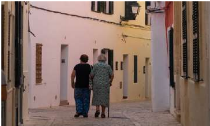
El projecte Radars es donarà a conèixer a la ciutadania amb una festa que se celebrarà el 30 de setembre.

És un projecte que busca la complicitat de l'entorn per donar suport a la gent gran en situació de soledat.