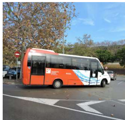
Des del 5 de setembre s'han ampliat els horaris.

També s'han modificat els horaris a les línies 690 i 646 que gestiona l'Ajuntament, amb la incorporació de noves expedicions pensades per incrementar la freqüència de pas, ampliar la cobertura nocturna del servei i facilitar