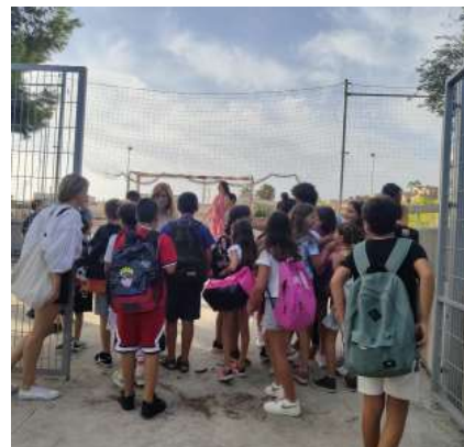
La tornada a l'escola s'ha avançat al 5 de setembre.

Aquest any, també com a novetat, entrarà en vigor i començarà a desplegar-se un nou currículum a primària, secundària i batxillerat. L'objectiu és que l'ensenyament passi a ser més competencial i que es treballi més transversalment relacionant les diferents assignatures. A més, els centres educatius tindran més autonomia per decidir quines assignatures volen potenciar més. Pel que fa al batxillerat, també serà més competencial i l'alum-