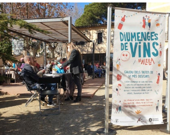
La primera sessió de Diumenge de Vins del 30 de gener.

El programa d'activitats enoturístiques de l'any inclou dues novetats destacades: es promocionarà l'oferta gastronòmica a través de descomptes, per afavorir la tornada de les persones visitants al municipi, i s'amplia l'oferta de visites guiades, reforçant especialment les propostes destinades al públic familiar.