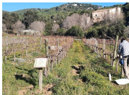
És un museu a l'aire lliure amb ceps de 30 varietats.

L'Ajuntament ha renovat els cartells informatius de la Vinya Testimonial d'Alella, que estaven molt deteriorats per l'efecte del sol. En concret s'han substituït el cartell gran que identifica la vinya, el panell informatiu de l'entrada i els nou cartells de cadascuna de les fileres que identifiquen les 29 varietats de ceps plantades.