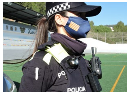
Dotació de càmeres unipersonals al cos policial.

La plantilla de la Policia Local té una nova companyia. És la Winter, una pastor belga malinois, de quatre anys, que posarà en marxa la primera unitat canina del municipi. La gossa és l'animal de companyia d'un dels agents que s'han incorporat al cos recentment. Conviu amb ell i sempre que sigui necessari la