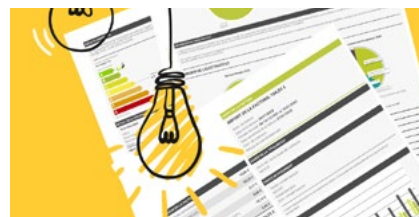
La xerrada sobre la factura elèctrica serà el 17 de febrer.

Emmarcades dins del projecte Passa l'Energia, que impulsa la Diputació per promoure l'estalvi i l'eficiència energètica als equipaments i per sensibilitzar la ciutadania, l'Ajuntament d'Alella ha programat dues xerrades relacionades amb el consum i l'estalvi de la despesa elèctrica que poden ser d'interès general de la ciutadania, amoinada per l'increment desorbitat del preu de la llum. El 17 de febrer a les 19h es farà una xerrada sobre la factura elèctrica i el 7 d'abril a la mateixa hora una sobre autoconsum d'electricitat. Les xerrades són virtuals i obertes a tothom.