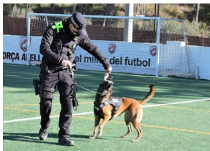
Nova unitat canina.

El cost del conjunt d'actuacions supera els 150.000 euros.