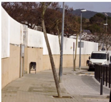
S'han ampliat les voreres de les entrades.

Entre d'altres actuacions, s'ha millorat la seguretat dels accessos a l'escola i s'ha posat gespa al pati d'infantil.