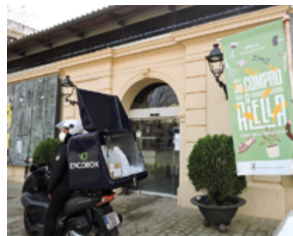
Un servei de repartiment lliurarà les comandes a domicili.