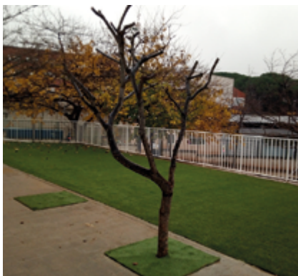
S'ha instal·lat gespa artificial al pati d'infantil.

L'Ajuntament ha enllestit deferents intervencions realitzades a l'entorn de l'Escola Fabra amb l'objectiu de millorar la seguretat dels infants i les seves famílies i dotar d'un major espai els accessos d'entrada i sortida al centre educatiu. Les obres han consistit en l'ampliació de les voreres de les entrades d'infantil i de primària, que han duplicat la seva amplada, i la protecció