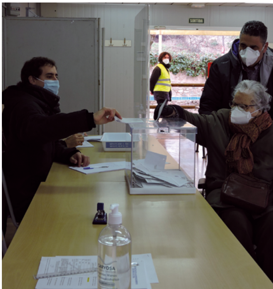
Les eleccions es van desenvolupar amb totes les mesures de seguretat necessàries per evitar riscos a la població.

L'Ajuntament va haver de retirar l'11 febrer l'estelada que oneja des de l'any 2012 al pati de Can Lleonart, per tal d'evitar que la retiresin els Mossos d'Esquadra en compliment d'una resolució de la Junta Electoral, que no va arribar a l'Ajuntament, que ordenava la retirada de la bandera. L'estelada, que va ser instal·lada en compliment d'un acord del Ple, torna a onejar des de l'endemà de les eleccions.