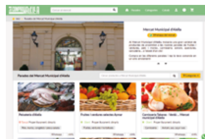
jocomproaaella.cat funciona des de l'1 de març.

Per animar a la ciutadania a posar a prova la compra virtual, l'enviament a domicili és gratuït en la primera comanda. En les següents, el cost establert és de 5,95 euros. Els horaris de repartiment són dimarts de 10 a 12h, divendres de 18 a 20h i dissabte de 12 a 14h, tot i que s'anirà ajustant en funció de les necessitats que es detectin. El repartiment també inclou El Masnou, Teià i Vallromanes.