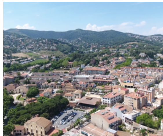
La modificació del PAM es va aprovar al Ple de febrer.

acordat eliminar-ne sis, crear-ne una de nova —l'anàlisi i reformulació de la gestió dels residus municipals— i reformular el contingut o el calendari de 25 de les intervencions previstes.