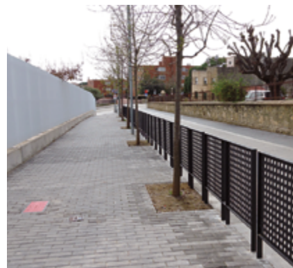
S'han instal·lat tanques protectores al C/ Miquel de Calderó

Per reforçar la seguretat a l'entorn escolar també s'han instal·lat bandes reductores de velocitat als dos costats dels passos de vianants i s'ha protegit l'accés lateral, des del carrer de Miquel de Calderó, amb més de 40 m de tanca metàl·lica. A l'interior de l'escola