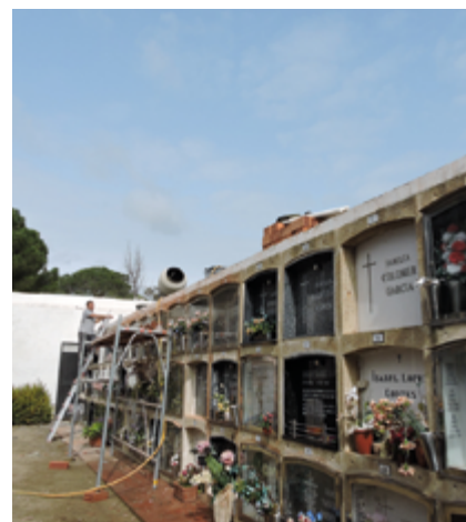
Els treballs es van iniciar el passat 22 de febrer.

Degut a la dificultat de poder ubicar més nínxols al recinte actual del cementiri l'Ajuntament està iniciant els