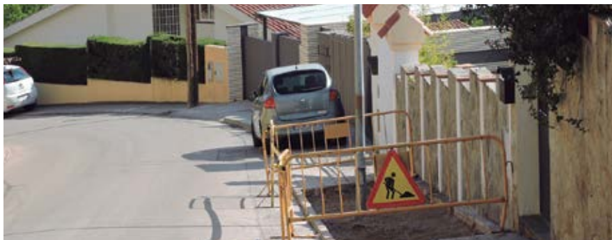
L'arranjament de voreres i calçades de Mas Coll forma part del paquet de 250.000 euros anuals destinats a pavimentació.

Els treballs tenen un cost de 134.935 euros i un termini d'execució de tres mesos.