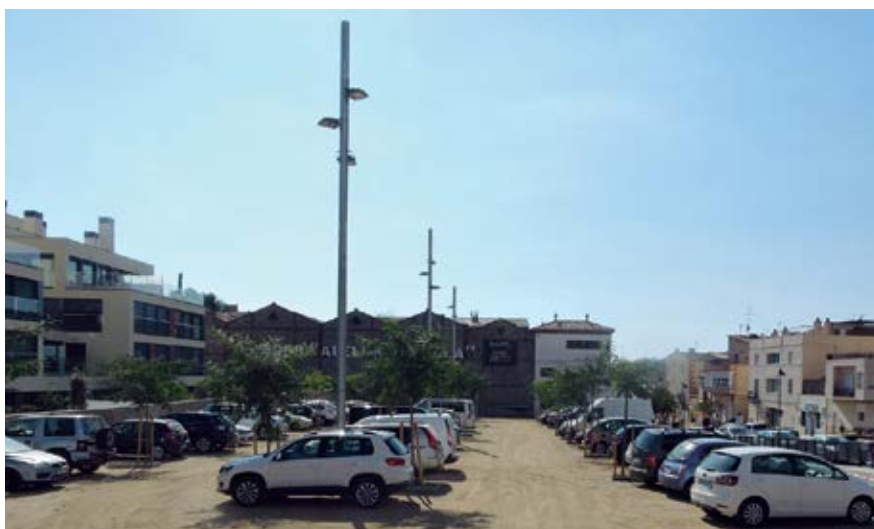
Entre les dues plataformes d'aparcament hi ha capacitat per a 137 vehicles.