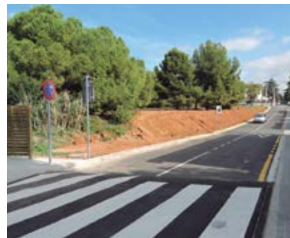
La nova imatge del carrer Lleida.

darrers mesos s'ha realitzat l'arranjament de paviments als trams que estan en més mal estat del barri d'Alella Parc, amb una inversió de 159.000€. Al mes de setembre també es van enllestir les obres d'ampliació, pavimentació i realització de voreres del carrer Lleida, entre el carrer La Vinya i l'avinguda d'Alella. Aquesta actuació ha tingut un cost de 86.000€ i ha estat possible gràcies a la cessió anticipada de terrenys realitzada l'any 2016 per un propietari.