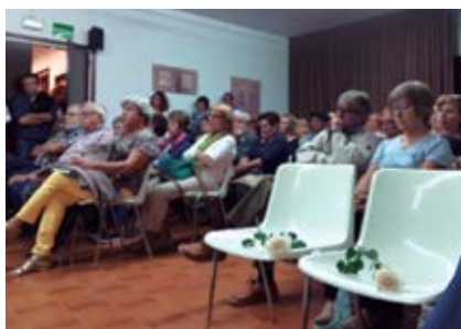
Cadieres buides en record dels "Jordis" empresonats.

Les dues mocions van ser aprovades per unanimitat amb el vot favorable dels 11 regidors presents a la sessió d'ERC+SxA, Gd'A, PDeCAT i AA-CUP. Van excusar l'assistència al Ple la regidora d'Alella Primer-CP per motiu de salut, i la regidora del PP que, segons va informar l'alcalde Andreu Francisco a l'inici de la sessió plenària, el 19 d'octubre va presentar una