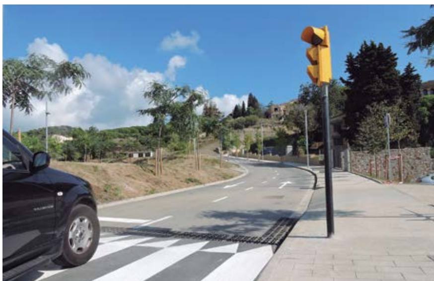
El nou vial és de sentit ascendent i té 400m de longitud i 9m d'amplada.

L'empresa encarregada de les obres ha refet la portalada de Can Calderó que va caure a terra.