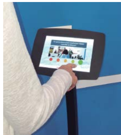
La pantalla està instal·lada a l'entrada de l'OAC.

El sistema selecciona les franges d'edat i el tipus de tràmits realitzats i aporta dades de satisfacció del servei, com ara el temps d'espera, el requerit per a la tramitació, l'atenció i el nivell de coneixement de la persona que l'ha atès i l'acomodament de l'espai. També permet fer suggeriments per tal de millorar el servei.