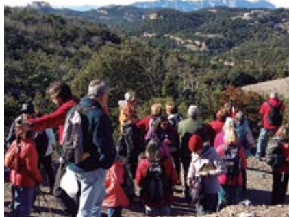
Enguany s'han programat quatre passejades i la cloenda.

Fins al 22 de desembre es poden fer les inscripcions a les sortides.