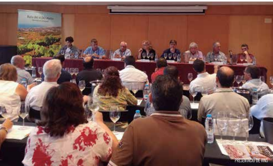
PRESENTACIÓ DE VINS