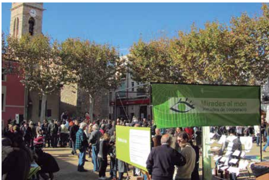
Les Mirades al Món van néixer l'any 2008 amb l'objectiu de reflexionar sobre les desigualtats internacionals.