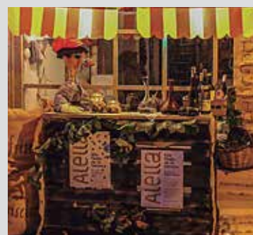
Premi votació popular: Friselina