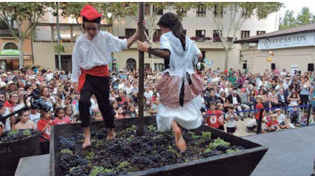
La trepitjada de raïm dels hereus, les dames d'honor i la pubilla és un dels actes més significatius de la inauguració.

Força participació a les activitats i més de 20.000 tiquets venuts a la Mostra Gastronòmica.