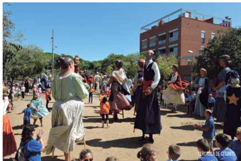
CERCAVILA DE GEGANTS