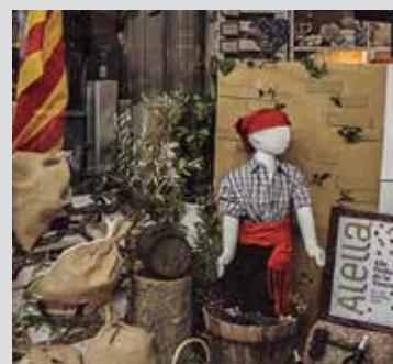
Tercer premi: Gurises