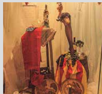
Segon premi: Maronas