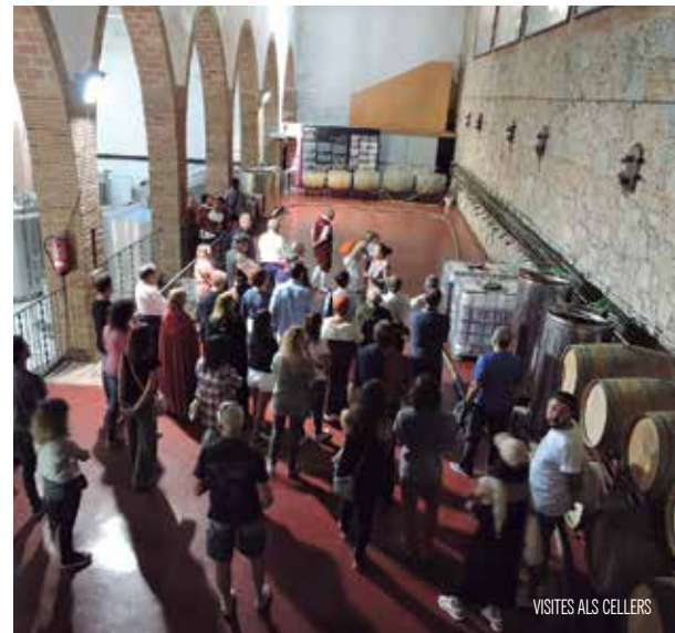
VISITES ALS CELLERS