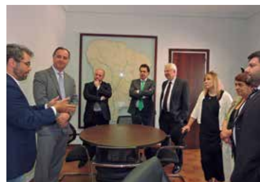
L'alcalde va rebre els representants de Mercosur.

Una delegació de Mercosur (Mercat Comú del Sud) amb set diputats i càrrecs electes de Brasil, Argentina i Uruguai, van fer parada a Alella el 6 de setembre en la seva visita a Catalunya, convidats per Diplocat.