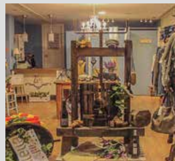
Primer premi: 2D4