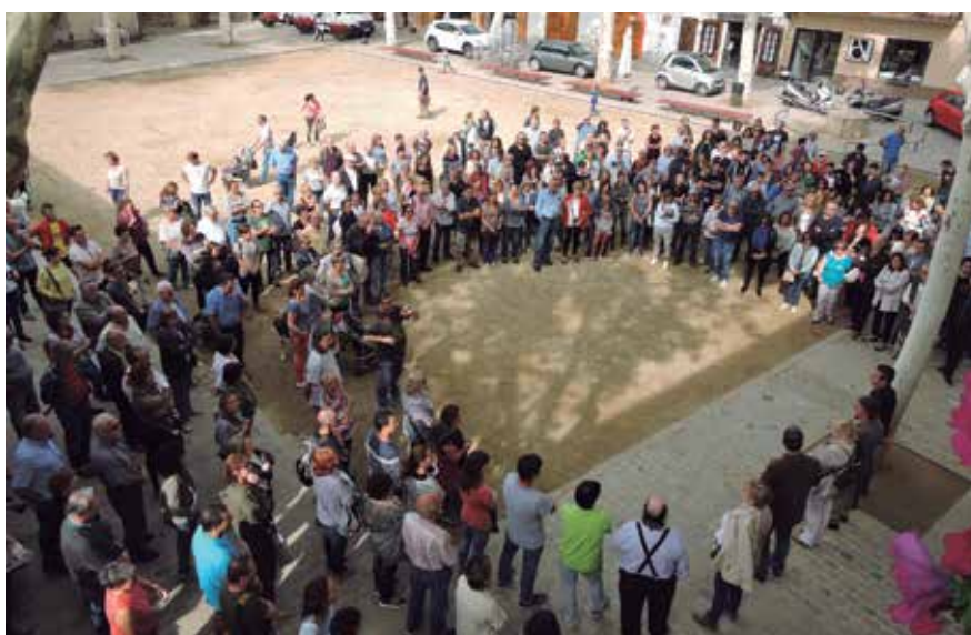
Unes tres-centes persones es van concentrar a la Plaça de l'Ajuntament l'endemà del referèndum.