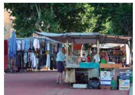
L'Ajuntament vol posar al dia l'actual ordenança.

fer suggeriments i propostes. La consulta estarà oberta del 10 al 29 d'octubre.