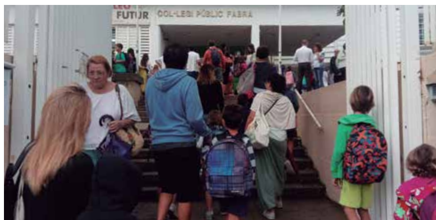
El curs va començar el 12 de setembre amb 192 alumnes a l'Escola La Serreta i 423 a l'Escola Fabra.

L'activitat va tornar a les aules de l'Escola Fabra i l'Escola La Serreta el 12 de setembre amb 616 alumnes, 20 menys que a l'inici del passat curs.