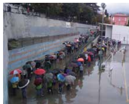
Cues al col·legi del Pavelló Municipal d'Esports.