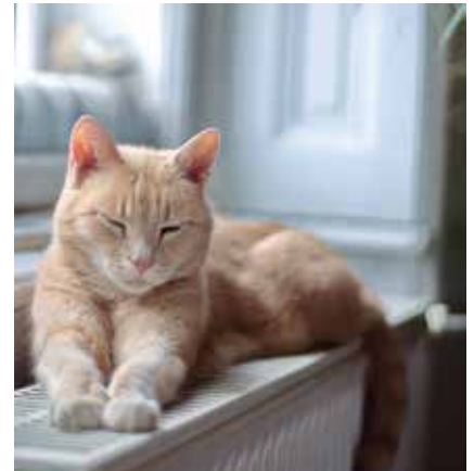
L'Ajuntament vol posar al dia l'actual ordenança.

Les aportacions es poden fer del 10 al 29 d'octubre, ambdós inclosos, emplenant el formulari que hi haurà pen-