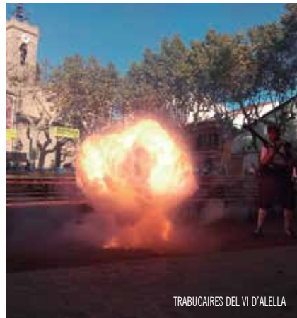
TRABUCAIRES DEL VI D'ALELLA