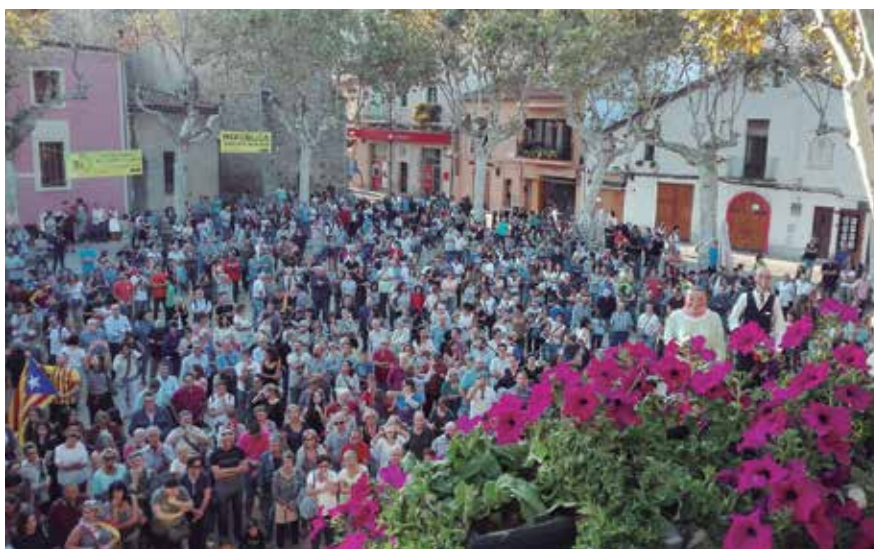
Centenars de persones es van concentrar a la Plaça de l'Ajuntament durant la jornada d'aturada general del 3 d'octubre.