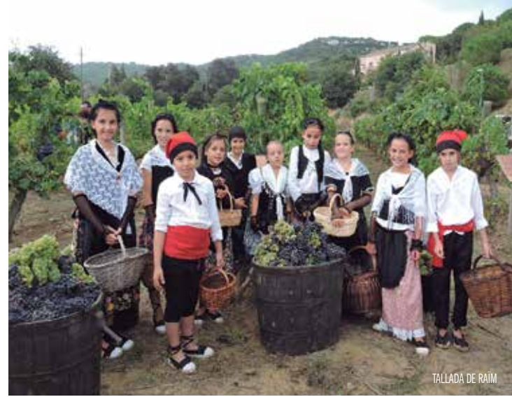
TALLADA DE RAÏM