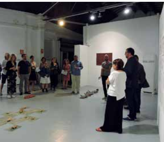
Inauguració de l'exposició "Allò que vindrà".