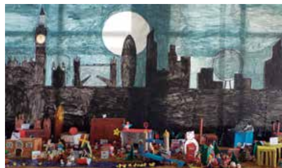
Escola Fabra, menció especial grup C. Restaurant Azahar, menció especial grup D.

Primer premi Residència Els Rosers Segon premi Llar La Gavina Tercer premi Residència Germans Aymar i Puig Accèssit Les Hortensies Menció especial Restaurant Azahar