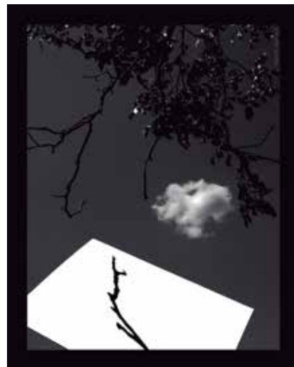
L'exposició s'inaugura el dia 20 de gener.

L'exposició s'inaugura el divendres 20 de gener a les 20h i es podrà visitar fins al 12 de febrer.