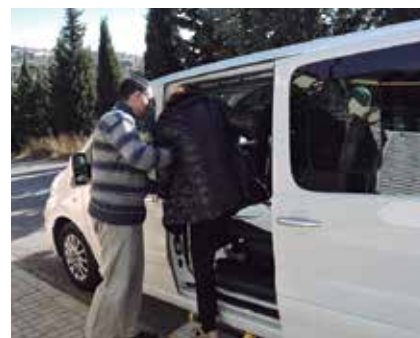
El servei va tancar l'any amb 140 usuaris i usuàries.