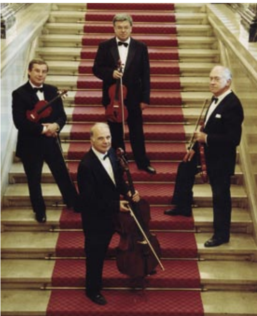
El Quartet Bartók actuarà als Jardins de les Quatre Torres.

Els jardins de Cal Marquès, de les Quatre Torres, el carrer Àfrica, el Parc Gaudí i de Can Sors són els escenaris del Festival 2006.