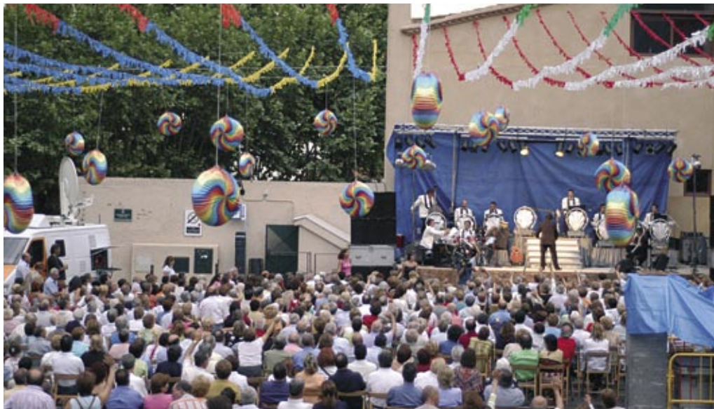
Les actuacions a l'Hort de la Rectoria seran gratuïtes per a tothom.

ol, les partides simultànies d'escacs del 30 de juliol, el XXVè Torneig de Futbol Sala, el minitennis que s'organitzen a la plaça de l'Ajuntament i l'Open de Tennis de Festa Major són les activitats esportives de la programació. Entre els concursos, el de dibuix infantil arriba enguany a la desena edició, mentre que el de peres farcides i el de truites es