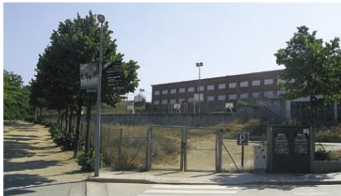
Terreny on hi haurà l'escola bressol, a prop de l'escola del Bosquet i l'Institut.

El nou equipament es construirà durant aquest any i es preveu que entri en funcionament el gener de 2007.