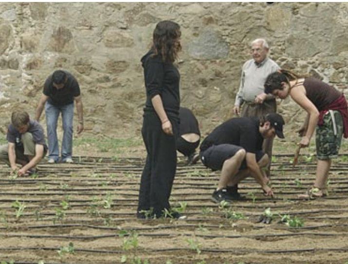
S'han plantat herbes aromàtiques per evitar plagues d'insectes.