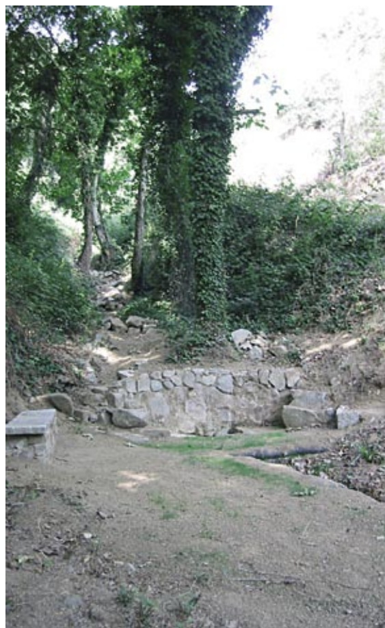
Imatge de la Font del Sarau, un cop restaurada.

Plantació de verns i freixes, espècies de ribera, a la llera del Torrent del Fonoll.