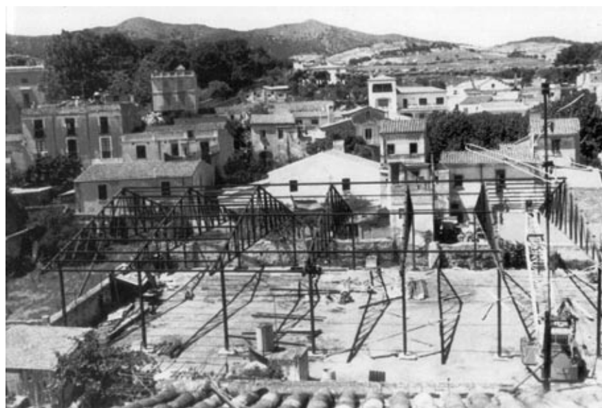
Construcció del Casal d'Alella, l'any 1970 (del llibre 'Alella, recull d'imatges').

Membres del Casal, de l'Ajuntament i de l'equip tècnic de la Diputació han visitat recentment els equipaments culturals de Cardedeu i La Llagosta per conèixer experiències recents i innovadores pel que fa a les estructures i la programació.