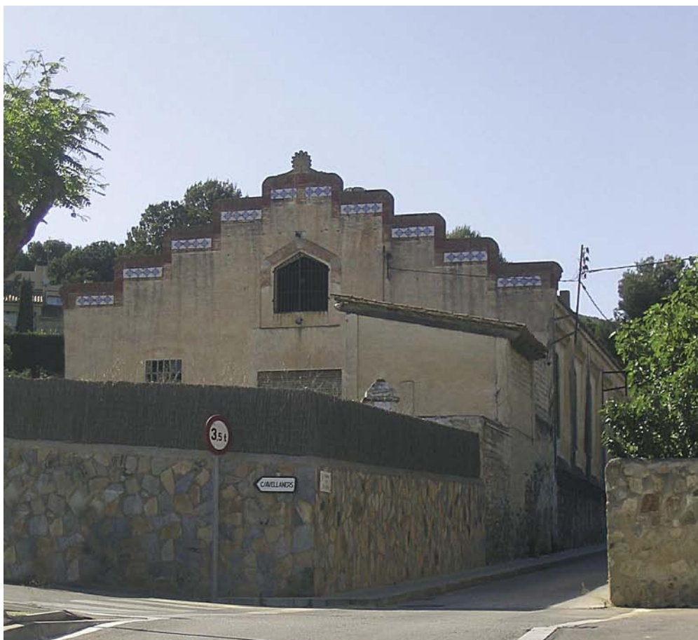
El govern municipal preveu incloure la façana modernista de l'edifici en el Catàleg de Patrimoni Històric i Arquitectònic.

El govern local té la intenció de restaurar l'edifici, amb façana modernista, per acollir la futura biblioteca municipal. En aquesta línia, ja s'han iniciat converses amb la Diputació de Barcelona, que col·laborarà en la redacció del programa de necessitats. Segons els paràmetres de la Diputació, els municipis amb 10.000 habitants haurien de tenir d'una biblioteca d'uns 1.000m 2 . Actualment Alella té