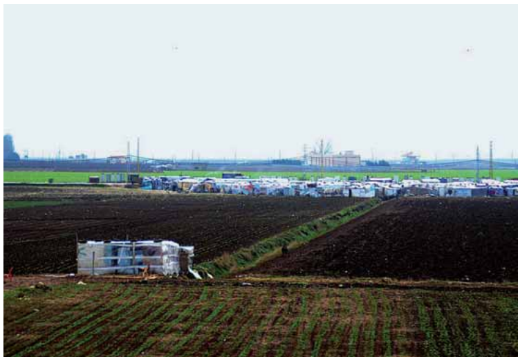
Tendes de campanya a un camp de refugiats al Líban (2015).