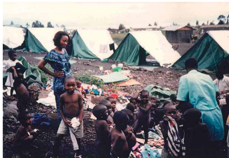
Famílies refugiades, RD Congo, 1994.

gulació en aquest àmbit i, així, conservar la seva llibertat d'acció pel que fa a la concessió de l'asil. Per tant, avui dia, si bé a l'àmbit internacional es reconeix el dret que tenen les persones refugiades a obtenir asil, encara segueix sense establir-se una obligació internacional correlativa que forci els Estats a la seva concessió, per la qual cosa l'exercici d'aquest dret depèn de la bona voluntat dels Estats als quals se sol·licita l'asil.