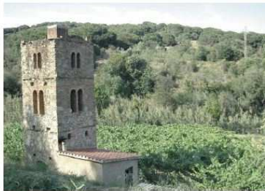
La torre de l'Estre vall de San Pau, a Mas Gall.

La sessió plenària del 22 de febrer va aprovar per unanimitat l'Inventari d'arquitectura rural i popular d'Alella, un treball elaborat durant l'any 2006 per un equip d'arqueòlegs. El document consta de dos volums i descriu un total de 127 elements que s'han classificat en quatre grups segons la seva tipologia: elements arquitectònics de reguard, treball i aïoliopluc oom poden ser barraques o coves entaïolades al sòl, elements relacionats amb l'abastament d'aigua com pous, mines o basses, elements arquitectònics relacionats amb la contenció de terres i construccions de caràcter religiós. Per dur a terme la catalogació, l'equip ha realitzat un minuciós treball de camp sobre el terreny i s'ha comptat, en moltes ocasions, amb informació facilitada per diverses fonts orals.